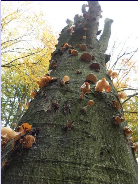
Beuk: Aantasting door paddenstoelen