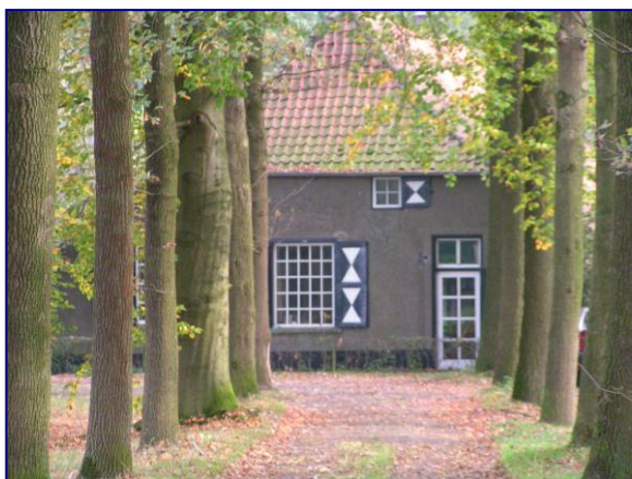
Eikenlaan, veelvoorkomend structurelement op historische buitenplaatsen

De Groene Monumentenwacht is aangesloten bij Vereniging Monumentenwacht Nederland, de overkoepelende organisatie voor alle monumentenwachten. Hiermee is de kwaliteit en objectiviteit gewaarborgd. Ervaring en kennis wordt meegenomen vanuit de Stichting tot behoud van Particuliere Historische Buitenplaatsen, die haar activiteiten na ruim 30 jaar per 1 januari 2011 zal beëindigen.