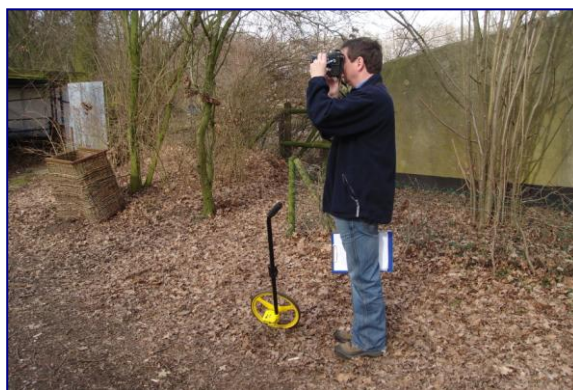
Opmeting voor het inspectierapport

De rapporten zijn zeer geschikt als basis voor subsidie aanvragen en voor het laten maken van offertes.