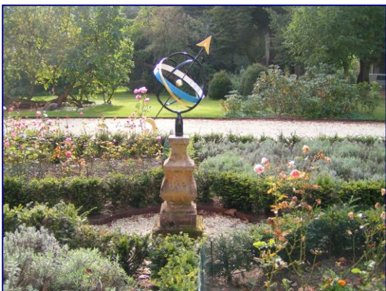
Siertuin met zonnwijzer

Abonnees kunnen bij ons terecht voor o.a. inspectierapporten, prestatieverklaringen en overige begeleiding bij de aanvraag.